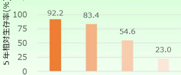
◇がん臨床病期別5年相対生存率 男女計(全がん)

公益財団法人がん研究振興財団「がんの統計19」 全国がんセンター協議会加盟施設における5年相対生存率(2009～2011年診療期)より作成