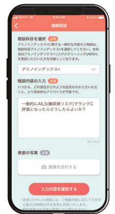
※画面はイメージです。

※本健康相談サービスは、医療行為にあたる診察・診断はできませんので、ご了承ください。