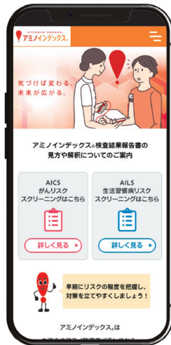
※画面はイメージです。